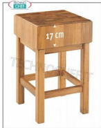
Ceppi in legno da cm 70x50, Spessore cm 17 con Piedistallo