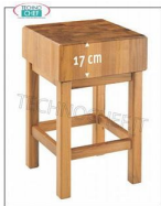
Ceppi in legno da cm 60x60, Spessore cm 17 con Piedistallo