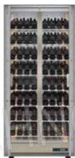
TV-C12 / TE-C12