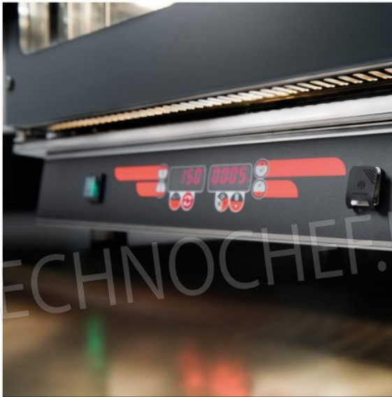
Pannello di controllo digitale