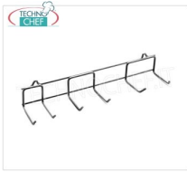
Fama - Supporto Parete per Combi, Mod.FSPC