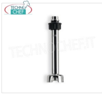
Fama - Utensile MESCOLATORE da 300 mm per Mixer ad immersione Linea Heavy, Mod.FM300