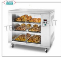
Vetrina calda ventilata con ruote