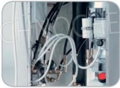
Particolare centralina e comandi