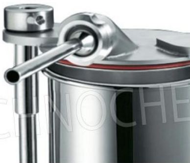
Ghiera inox opzionale