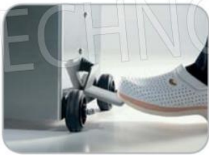
Azionamento spinta pistone