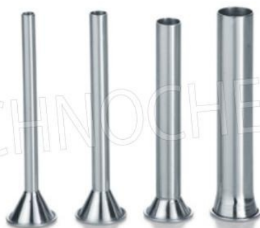
Imbuti inox (ø 13-16-20-25-28-38) opzionali