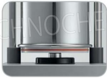
Guarnizione ermetica su cilindro oleodinamico