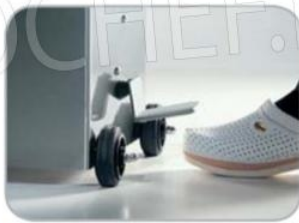
Ritorno pistone automatico