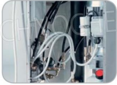
Particolare centralina e comandi