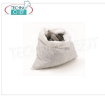
TECHNOCHEF - Confezione pietra lavica, Mod.05050501