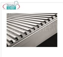
TECHNOCHEF - Grigliato di Cottura Universale, Mod.14080056