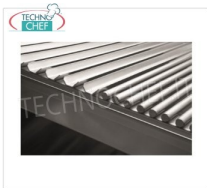
TECHNOCHEF - Grigliato di Cottura Misto Carne/Pesce, Mod.14080033