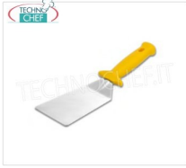
TECHNOCHEF - Paletta, Mod.10080038